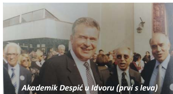
Akademik Despić u Idvoru (prvi s leva)