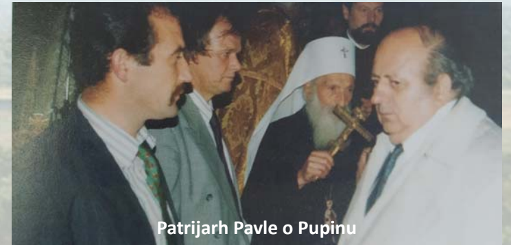
Patrijarh Pavle o Pupu