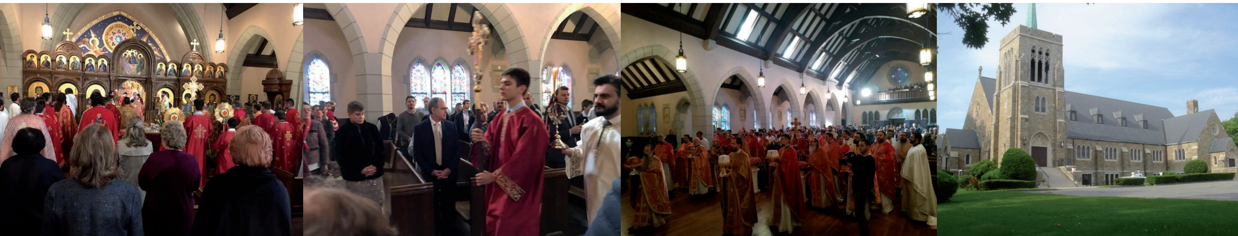
Proslava 800 godina autokefalnosti u crkvi Svetog Save u Bostonu