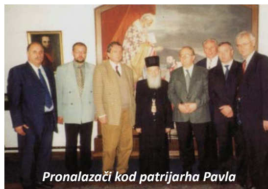
Pronalazači kod patrijarha Pavla