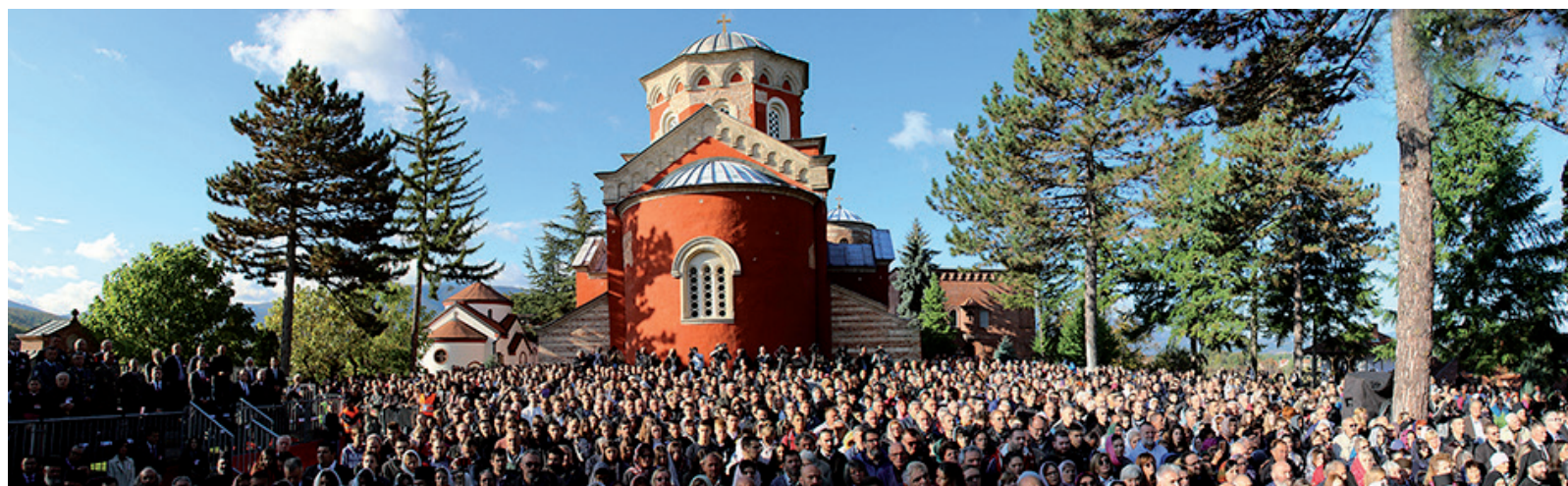
Proslava 800 godina autokefalnosti, manastir Žiča

U Bostonu 1892. Pupin je održao predavanje u Američkom Institutu Elektroinženjera gde se prvi put sreo sa Nikolom Teslom.