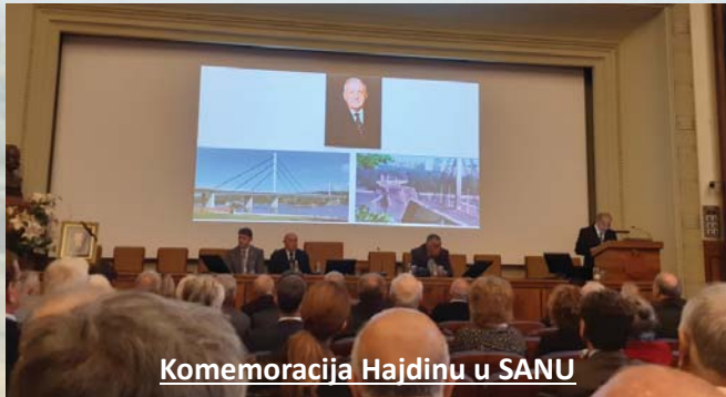
Komemoracija Hajdinu u SANU