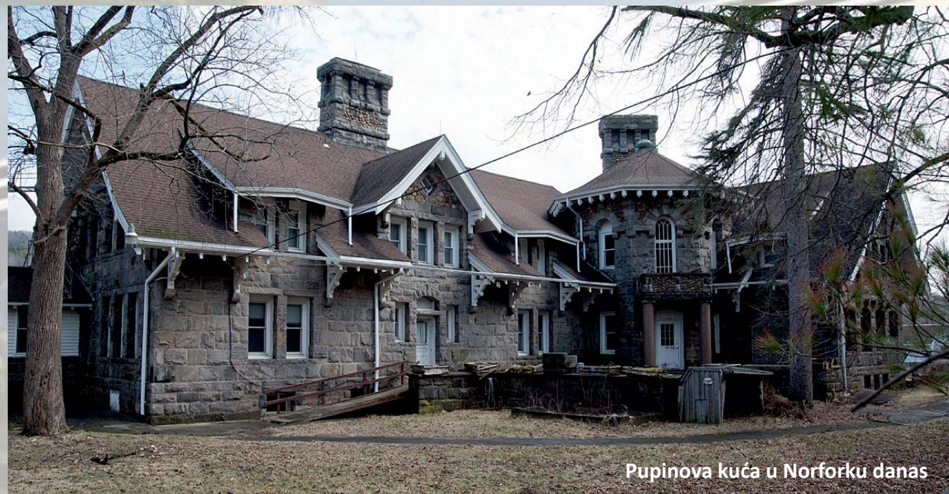
Pupinova kuća u Norforku danas