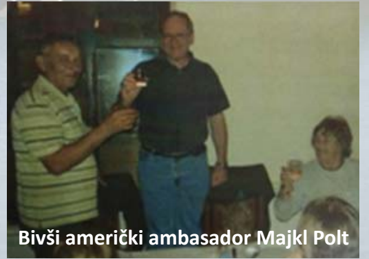
Bivši američki ambasador Majkl Polt